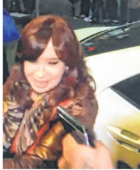
The attempt to kill Cristina was caught on camera

The vice-president did not appear to have suffered any injury, and the man was overpowered within seconds as he stood among a